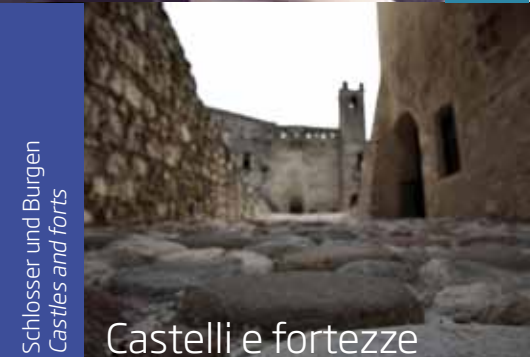
Castelli e fortezze