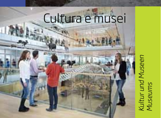
Cultura e musei