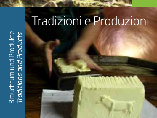
Tradizioni e Produzioni